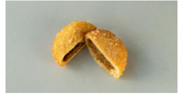
カレードーナツ 260円

プレーン生地の中に粒あんを入れて揚げた丸型のドーナツです。仕上げにきな粉をまぶし、かたち、味ともに“おはぎ”を表現しました。