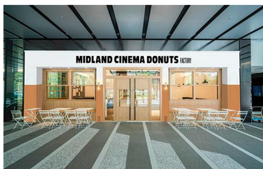
イメージパース。シンフォニー豊田ビル1階。 テイクアウトして、2階シネマへそのまま持ち込み可。