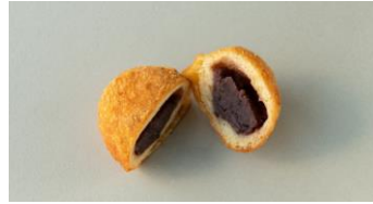
おはぎドーナツ 260円

プレーン生地の中に粒あんを入れて揚げた丸型のドーナツです。仕上げにきな粉をまぶし、かたち、味ともに“おはぎ”を表現しました。