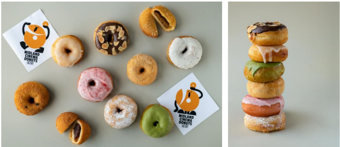
抹茶ホワイトチョコレート

※個数制限を設けさせていただきます。予めご了承ください。 ※価格はすべて税込みです。