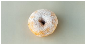
小倉クリームチーズ 280円

「ミッドランドシネマ ドーナツ ファクトリー」の原点となるドーナツ。国産小麦ユメチカラ（強力粉）を主体にバケットやカンパニーで使用されるフランス産の小麦リスドール（中力粉）とライ麦粉をブレンドした生地が特徴です。発酵時間にもこだわり、揚げたての仕上がりは格別です。仕上げのきび糖がさらに美味しさを引き立てます。