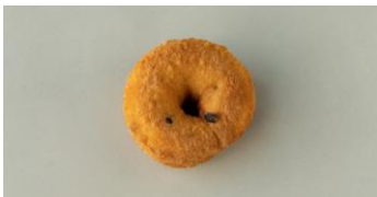
シナモンカレンツくるみ 280円

チョコレートを練り込み、揚げあがりにたっぷりのチョコレートとアーモンドでコーティングしたドーナツです。