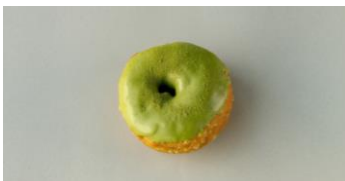
抹茶ホワイトチョコレート 280円

イチゴパウダーを練り込んだ生地。揚げあがりにはイチゴ味のホワイトチョコレートをまぶした“イチゴミルク”味のドーナツです。