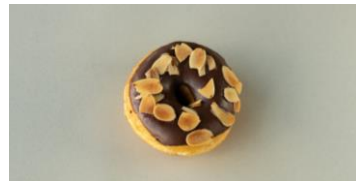
アーモンドチョコレート 280円

レモンピールのコンフィチュールを加え、仕上げに甘酸っぱいアイシングでデコレーションしました。