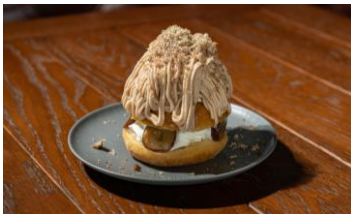
モンブラングラーセ 600円

プレーンドーナツにフレッシュなイチゴと生クリームをサンド。ソフトクリーム、イチゴソース、フリーズドライのイチゴパウダーをふりかけた甘酸っぱいドーナツ。さっぱりとしたソフトクリームはドーナツと相性もぴったり。