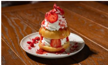
ストロベリークリーム 600円

プレーンドーナツにフレッシュなイチゴと生クリームをサンド。ソフトクリーム、イチゴソース、フリーズドライのイチゴパウダーをふりかけた甘酸っぱいドーナツ。さっぱりとしたソフトクリームはドーナツと相性もぴったり。