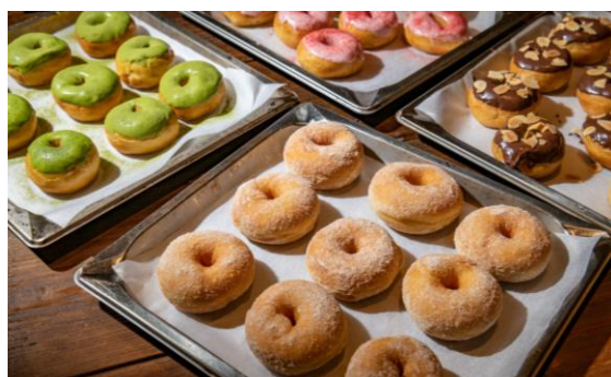
ふんわりもちりの食感にこだわったオリジナルドーナツ。 スイーツ系から総菜系まで全10種類。