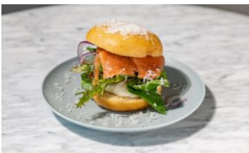
スモークサーモン タルタルソース 600円

プレーンドーナツに生クリームと栗の渋皮煮をサンド。ソフトクリームとモンブランクリームをたっぷりとかけ、仕上げに栗のパウダーをまぶした季節限定ドーナツ。栗づくしのドーナツは秋の味覚満載で食べ応え抜群。